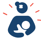
Madre víctima de violencia